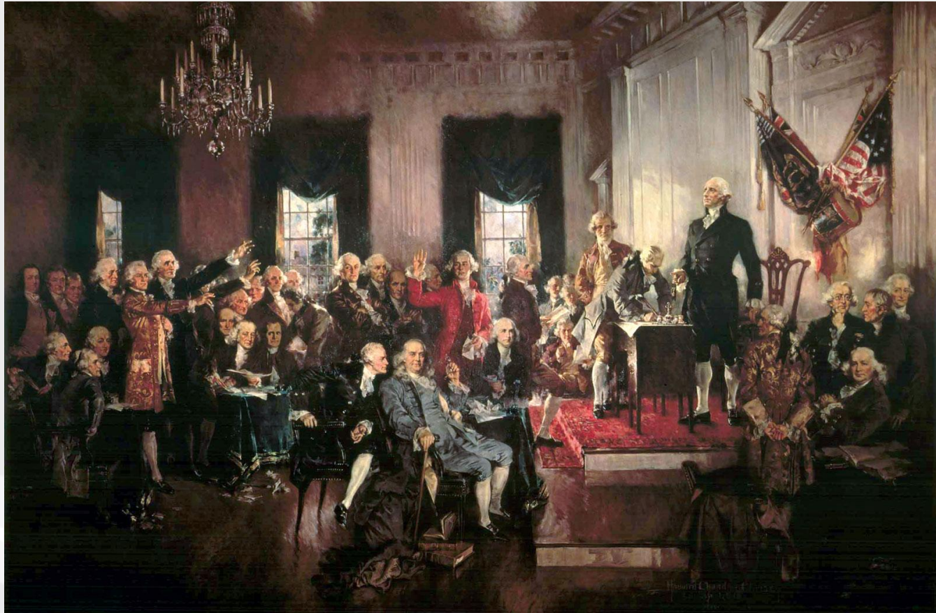
Philadelphia Convention 1787